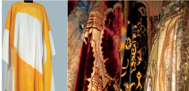
Messgewand, Klaus Simon