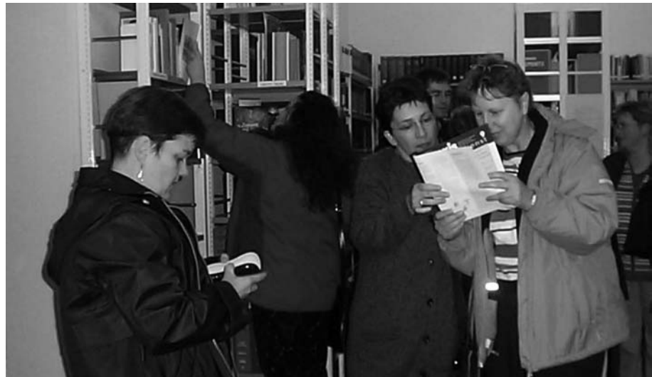
Vertraut werden mit der Sprache der Theologie und der Liturgie: zu Besuch in der Bibliothek des Deutschen Liturgischen Instituts

Mancher von Ihnen mag gelegentlich über Fachausdrücke und Fremdwörter in den Lehrbriefen stöhnen. Wir haben uns bemüht, die Lehrbriefe so verständlich wie möglich zu gestalten und die wichtigsten Fachausdrücke nicht nur im Lehrtext selbst, sondern dazu noch jeweils in einem Verzeichnis von Fremdwörtern und Fachausdrücken (einem Glossar) am Ende jedes Lehrbriefes zu erläutern. Jede Wissenschaft hat ihre eigenen Begriffe und Denkformen. Liturgiewissenschaft ist ein Teil der Theologie, und wer sich mit Theologie befasst, der kann es sich nicht ersparen, auch mit theologischem Denken und theologischer Sprache vertraut zu werden. Das ist, vor allem zu Beginn, oft ein mühseliges Geschäft. Aber mit der Zeit werden Sie entdecken: Mit dieser Sprache und diesem Denken kann man vertraut werden ; sie bringen etwas ein an Erkenntnis und Verständnis. Einerseits sind Sie dann fähig, die liturgischen Vorschriften der Kirche zu verstehen und die liturgischen Bücher der Kirche zu benutzen. Andererseits lernen Sie, in Gesprächen und Diskussionen über die Liturgie sicher und sachgerecht zu argumentieren und über diesen Kurs hinaus vielleicht auch weitere theologische bzw. liturgische Fachliteratur zu lesen.