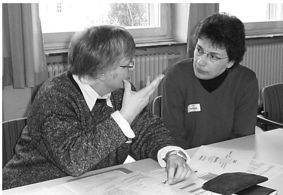
Den Austausch suchen: Begegnung während eines Studienwochenendes

Man hält beim Lernen besser durch, wenn man dabei die »moralische Unterstützung« anderer erfährt. Versuchen Sie, möglichst einen solchen Rückhalt zu gewinnen ( in der eigenen Familie oder Ordensgemeinschaft, bei Freunden, bei Ihrem Mentor, Ihrer Mentorin ... ). Falls Sie die Chance haben, sich gelegentlich mit Mitstudierenden auszutauschen, machen Sie davon Gebrauch.