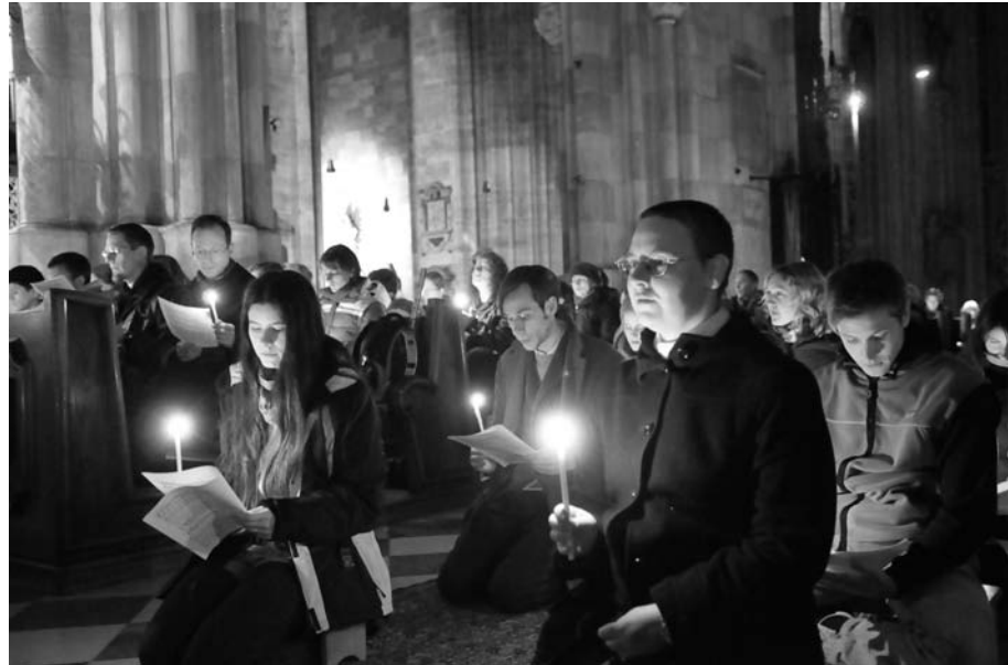
Dasein vor Gott: Gottesdienst mit Gesängen aus Taizé

Gott zu stellen; unser Leben in sein Licht zu halten. Gesellschaftliche, politische und soziale Probleme werden nicht an den Rand geschoben, sondern haben einen Ort im Gottesdienst der Gemeinde. Hier können wir Hoffnung schöpfen aus der göttlichen Verheißung des Friedens und des Heils, zu dem wir unterwegs sind und das wir sinnenfällig schon heute erfahren.