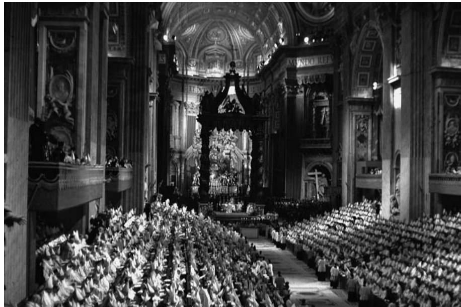
Zweites Vatikanisches Konzil: Feierliche Eröffnung am 11. Oktober 1962 in St. Peter in Rom.

Diese Einsicht leitete auch die Teilnehmer des Zweiten Vatikanischen Konzils. Dieses Konzil war für die Kirche das einschneidendste Ereignis des 20. Jahrhunderts. Seine Bedeutung hat es in ganz unterschiedlichen Bereichen des kirchlichen Lebens und Wirkens entfaltet. Einberufen von Papst Johannes XXIII. kamen von 1962 bis 1965 in mehreren Sitzungsperioden die Bischöfe der ganzen Welt zum Konzil zusammen.