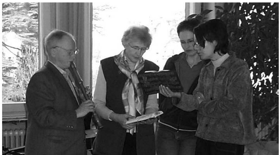
Zusammenklang: Eine Teilnehmergruppe übt für den Gottesdienst.

Auf dem Programm der Studienwochenenden erfahren Sie jeweils, welche Bücher und anderen Materialien Sie mitbringen sollen. Da die gemeinsame Feier von Gottesdiensten an den Studienwochenenden ein wichtiger Programmpunkt ist, können Sie dort Ihre gottesdienstlichen Erfahrungen und auch Ihre musikalischen Talente einbringen. Wenn Sie also z. B. ein handliches Musikinstrument (z. B. Flöte oder Gitarre) besitzen und beherrschen, wäre es schön, wenn Sie es zum Studienwochenende mitbringen könnten.