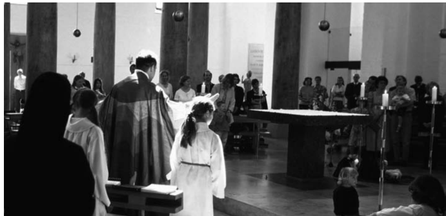
Versammelt im Namen des Herrn: Eine Gemeinde feiert den Sonntagsgottesdienst.

Diese wenigen Beispiele haben schon gezeigt, dass Gottesdienste uns in vielfältigen Formen begegnen: die Messfeier am Sonntag und Werktag, Wort-Gottes-Feiern, die Feier der Sakramente, die Feier von Morgen- und Abendlob, die hohen Festtage wie Ostern und Weihnachten mit ihren besonderen Feiern, Andachten, Prozessionen, Segnungen. Manches kennen Sie vielleicht nur aus der Erzählung, von Bildern aus der Zeitung oder dem Fernsehen. Womit sind Sie vertraut? Welche Gottesdienste feiern Sie gern und häufig?